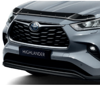
Вітровики; Дефлектор капота