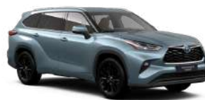
1K5 Сіро-блакитний, перламутр