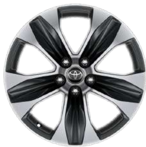
Легкосплавні диски 18"