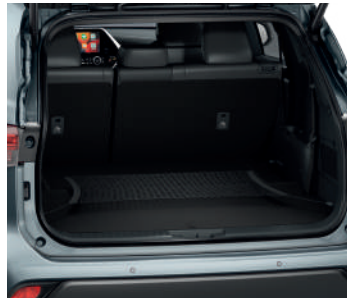
Горизонтальна сітка кріплення вантажу