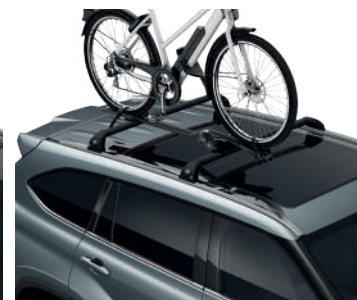
Кріплення для велосипеда