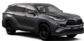
1G3 Сірий, металік