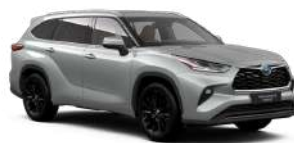
1J9 Сріблястий, металік