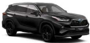
218 Чорний, металік