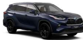
8X8 Темно-синій, металік