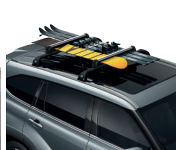
Кріплення для лиж та сноуборда