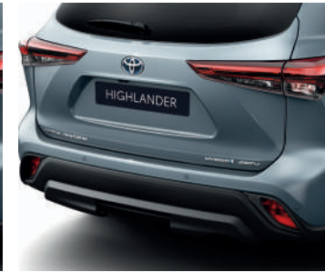
Накладка бампера під фаркоп