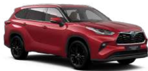
3T3 Червоний, перламутр