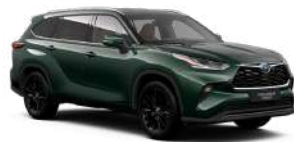
6X5 Зелений, металік