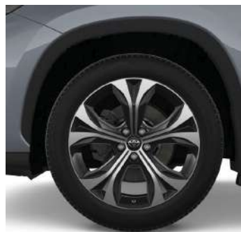
Легкосплавні диски 20"