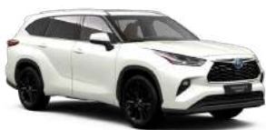
089 Білий, перламутр